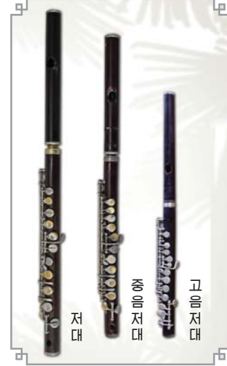
저대에 쓰이면서 사람들에게 민족의 고유한 흥취와 맛을...