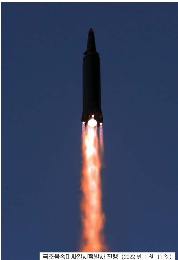
극초음속미사일시험발사 진행 (2022년 1월 11일)