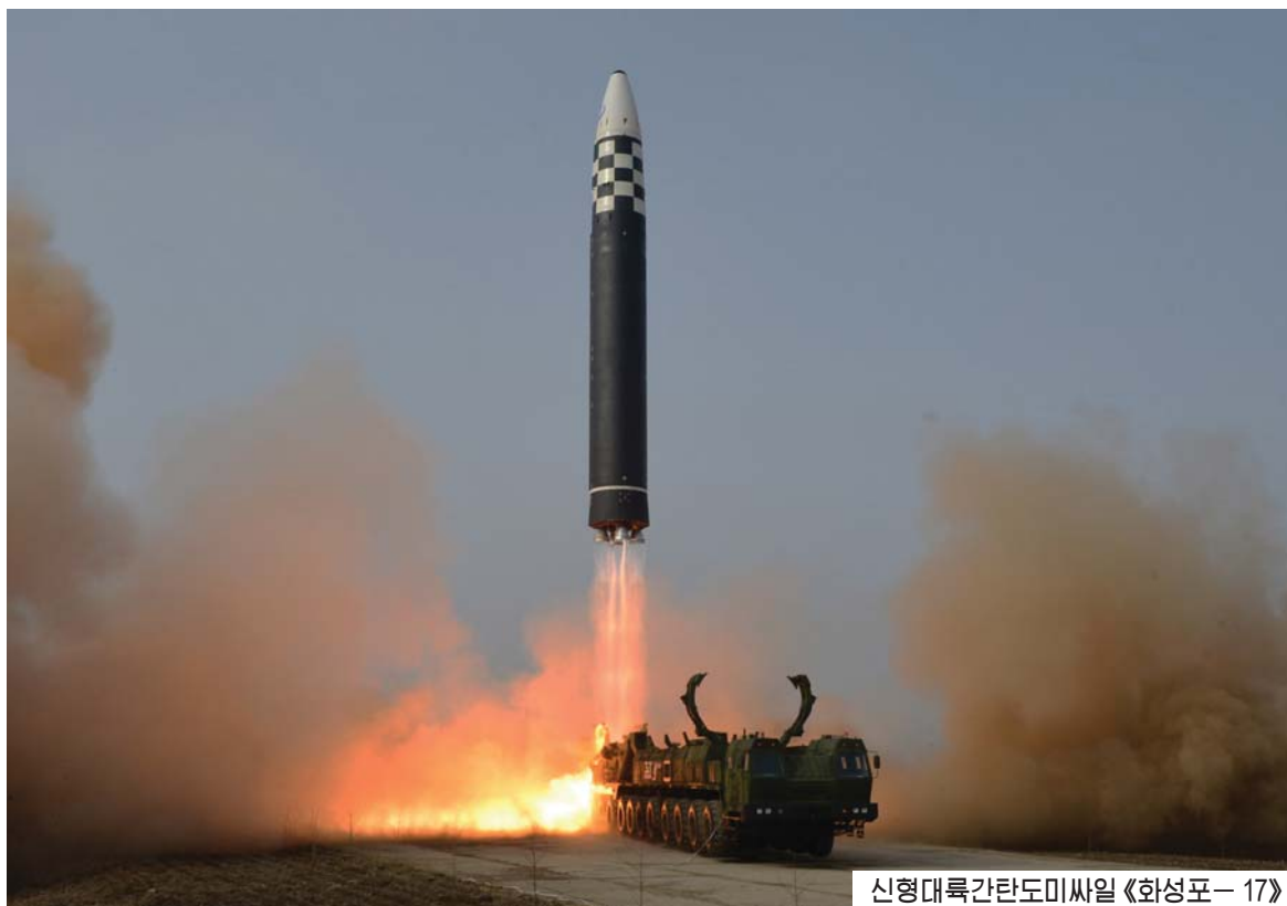
신형대륙간탄도미사일 《화성포-17》형 시험발사 진행 (2022년 3월 24일)