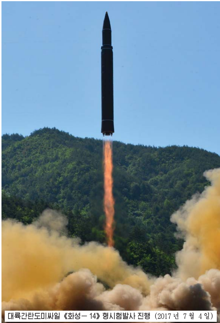
대륙간탄도미사일 《화성-14》형 시험발사 진행 (2017년 7월 4일)