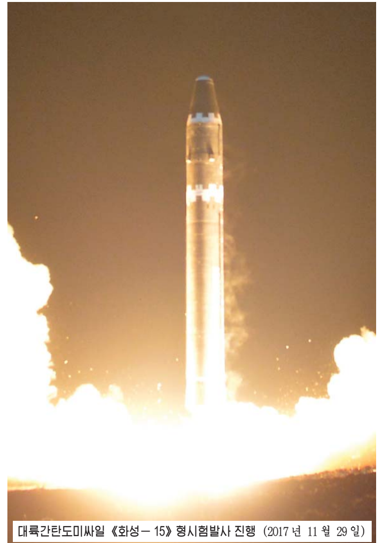
대륙간탄도미사일 《화성-15》형 시험발사 진행 (2017년 11월 29일)