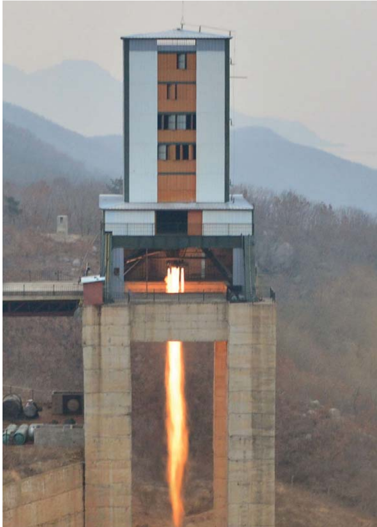
우리 식의 대출력발동기시험분출시험 진행 (2017년 3월 18일)

지난 24일 주체조선의 절대적 힘, 군사적강세를 힘있게 과시하며 신형대륙간탄도미사일시험발사가 단행되었다.